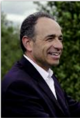
Jean-François Copé Maire de Meaux Président de la CAPM

Bien fidèlement à vous Jean-François Copé